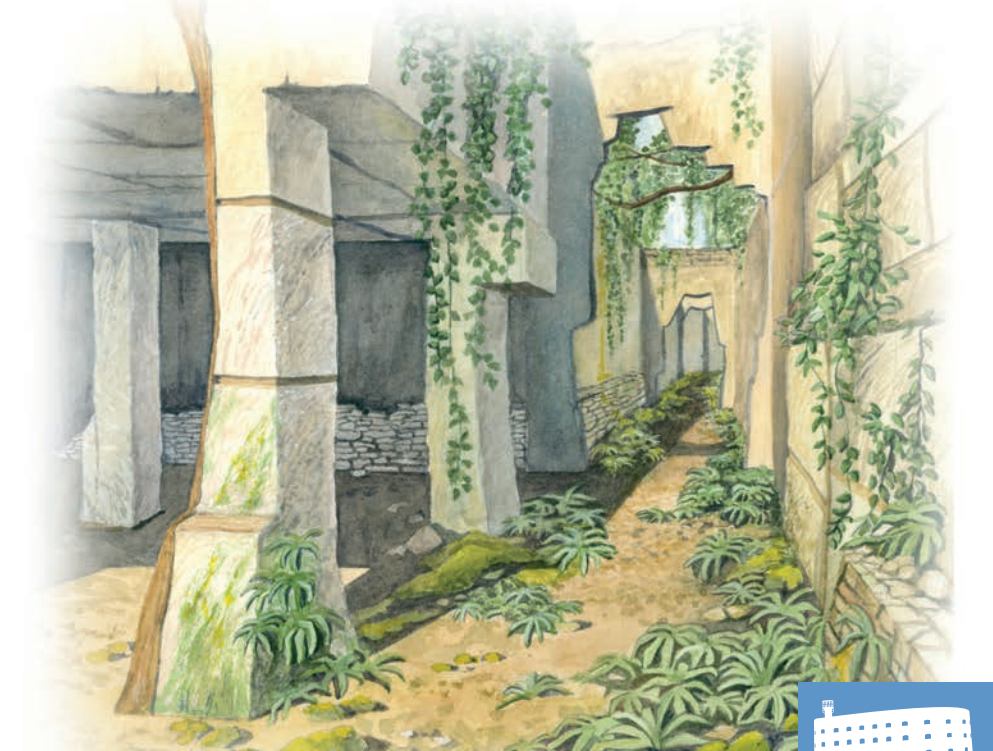
La même salle aujourd'hui gagnée par la végétation...