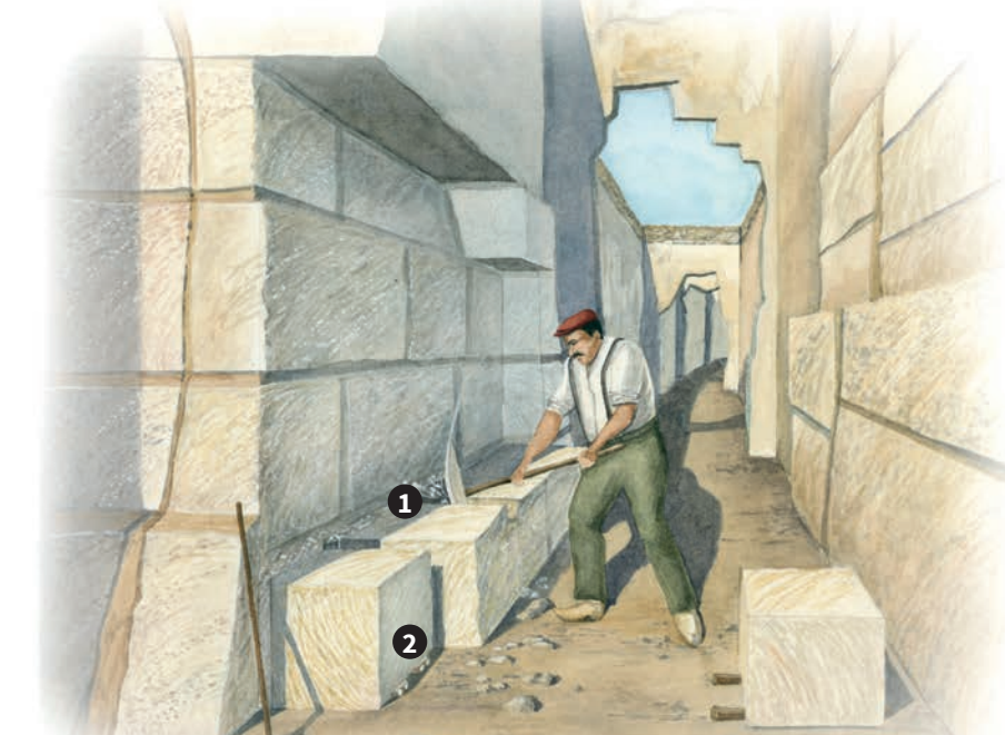
Une salle au temps de l'exploitation des carrières : armé d'un pic à trancher, le carrier réalise une tranchée verticale de 8 cm autour du bloc 1. Des coins et des paumelles 2 permettent de dégager sa face ancrée au sol.

la masse de se décoller. Après l'extraction, les carriers déplacent le bloc de pierre en le faisant glisser sur des rondins de bois 11. Une fois à la surface, leur prix sera négocié avec le marchand de pierre 12.